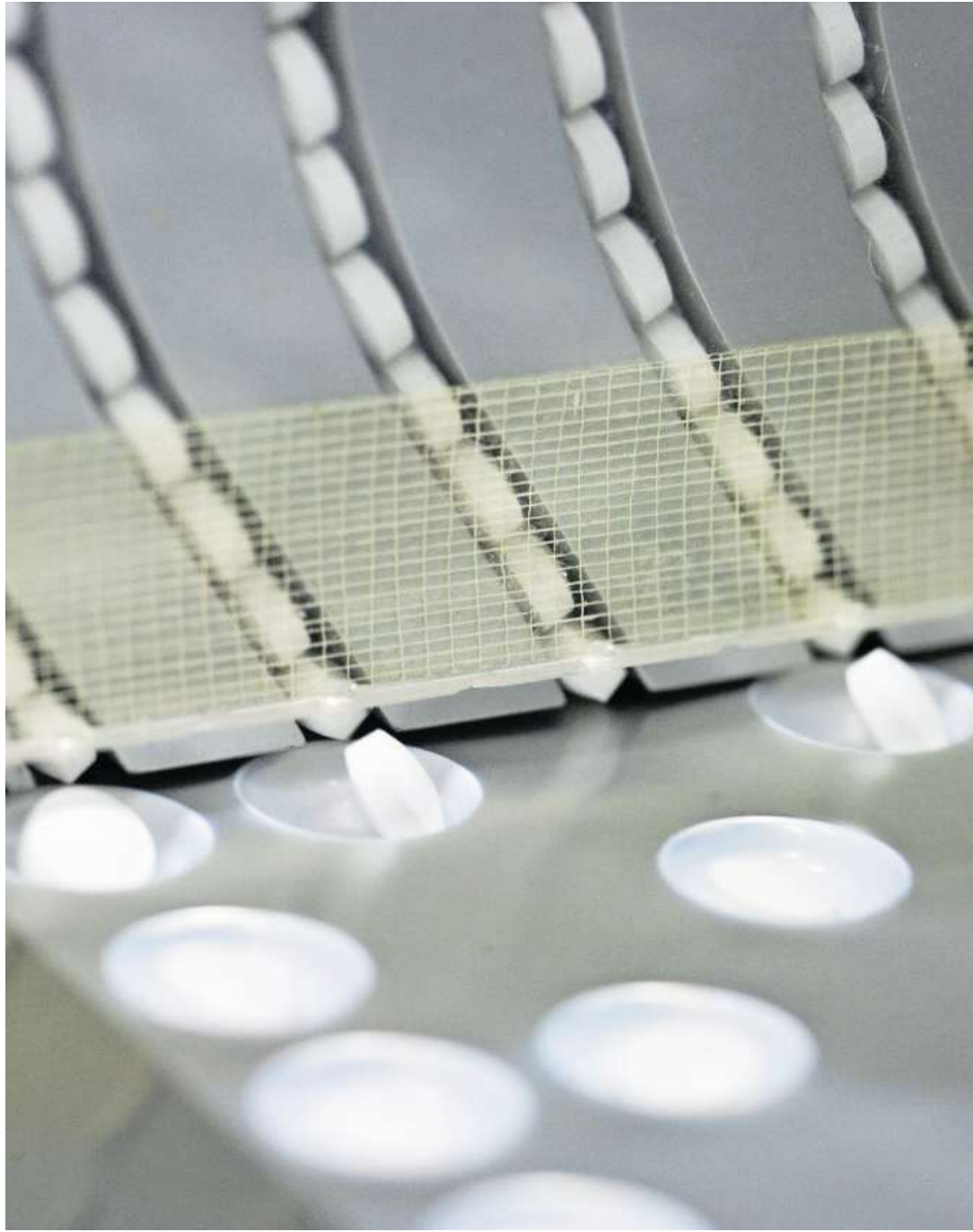
Der Marktanteil von Generika beträgt 14 Prozent.

Um Kosteneinsparungen bei Generika zu ermöglichen, hat der Bundesrat beschlossen, ein Referenzpreissystem für Medikamente, deren Patent abgelaufen ist, auszuarbeiten. Damit kann das Bundesamt für Gesundheit den Höchstpreis festsetzen. Die Massnahme bedingt eine Änderung des Krankenversicherungsgesetzes. Sie wird im Lauf des Jahres in die Vernehmlassung geschickt und soll 2020 in Kraft treten. Eine Allianz von Pharma-